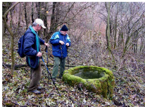
Studňa, ktorá zásobovala trkač